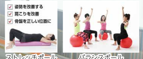
ストレッチボール

●教室をお休みにした回数分、プール又はジムのどちらかを一般利用としてご利用いただけます。 (子ども水泳教室の場合はプールのみ) ※振替期間は、平成31年3月24日(日)までとなります。 ※短期教室の場合は対象外となります。 ※他の教室には振替えることはできません。 ※園児はプール利用料が無料の為、一般利用に伴った保護者1名を振替対象と致します。